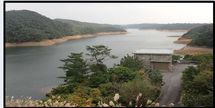
福地ダムの様子(12/31 14時)