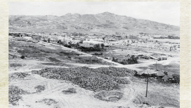
【写真】1945年に江口区から運玉森方面を望む。

このように、運玉森での激しい戦闘で、生命の危険と戦争の悲惨さを感じた住民の姿が垣間見られます。(文責:川島淳)