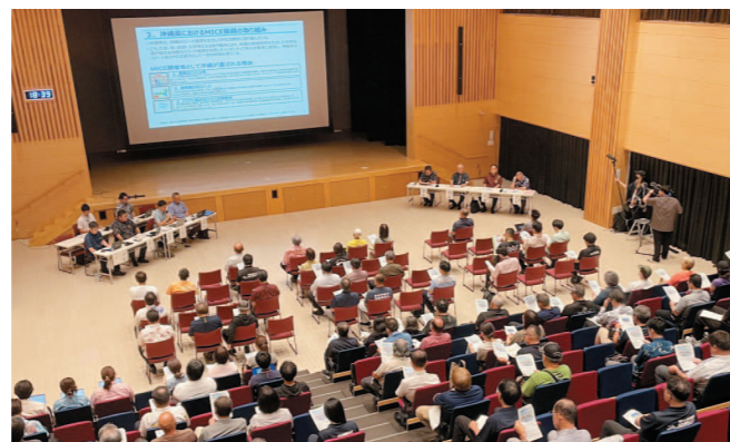
住民説明会の様子

説明会では、沖縄県MICE推進課による基本計画（改定案）の説明が行われました。来場者からはMICE施設