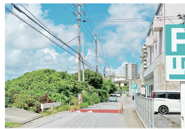
真志喜駅付近から大山駅方面を望む(2025年筆者撮影)

なぜ、わざわざ国名を冠する必要があるのでしょうか。多くの場合、旧国鉄において同名(同字)駅がすでに開業しており、先述の例でも小杉駅(富山)、湯沢駅(秋田)、赤穂駅(長野)がありました。遠く離れた駅同士とはいえ、乗車券などでは神奈川県の小杉駅なのか、富山県の小杉駅なのか、明確に区別する必要があります。仮に神奈川県の小杉から富山の小杉に行くとした場合、「小杉より小杉ゆき」という乗車券になってしまいます。そのため同名駅がある場合は国名を冠することが多くなっているのです。