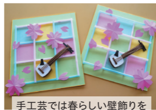
手工芸では春らしい壁飾りを 作成しました