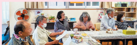
茶話会では、コーヒーやお茶を飲みながら、 みんなでゆんたくしました

ゆくりカフェは、認知症について学び、 困りごとを相談できる支援スペースで す。最近、もの忘れが気になりますか? 今月は保健師が血圧についてお話しす。 ぜひご参加ください。