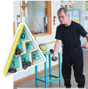
手作りの三角ボードでゲーム を楽しんでいます