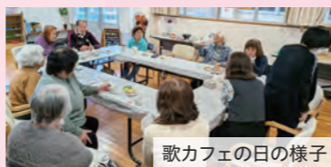
歌カフェの日の様子

ゆくりカフェは、認知症について学び、困りごとを相談できる支援スペースです。最近、もの忘れが気になりますか? 今月はエンディングノートについてお話しします。ぜひご参加ください。