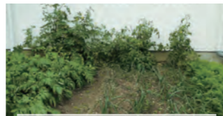
ジャガイモ、タマネギ、トマト、ニンジン。12月に植えた野菜が生き生きと育っています。収穫が楽しみです♪