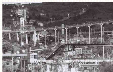
【写真1】与那原テックの全景