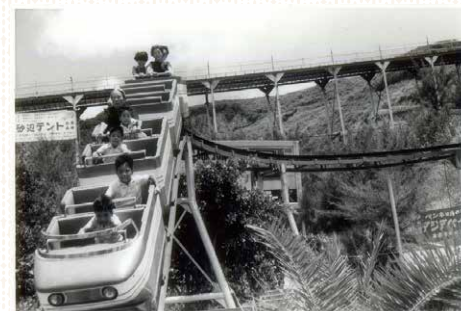
【写真2】沖縄初のジェットコースター