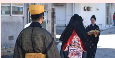
魔よけの力を持つとされる黒朝をかぶって会場へ