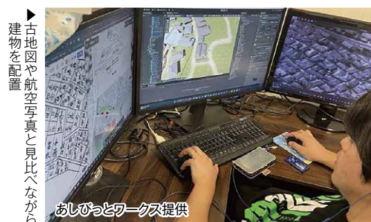
▶ 古地図や航空写真と見比べながら建物を配置

おり、戦前の沿線風景が驚くほど緻密に表現されている点が魅力です。運転レバーをゆくり押し込むと、サトウキビ畑や民家、通学する子どもたち、行商の人の姿などが次々と目に入り、「動く歴史資料」として当時の生活文化を楽しく学ぶことができます。