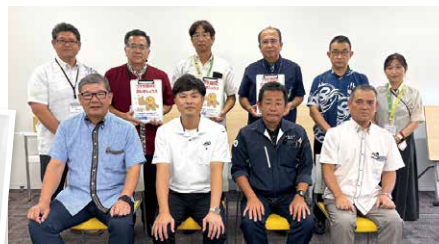
寄贈式には寄贈企業3社、3小中学校の校長・教頭先生・教育長が参加しました＝役場会議室