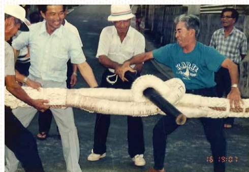
【写真1】上与那原における綱引きの写真