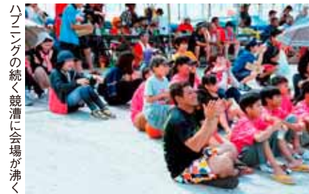
ハフニングの続く競漕に会場が沸く