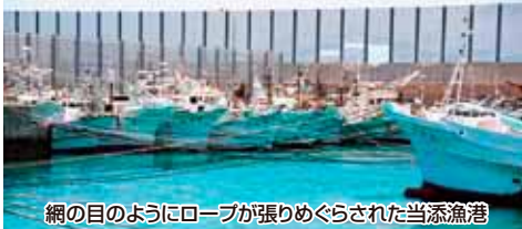
網の目のようにロープが張りめぐらされた当添漁港

漁業者たちにとって船は「第二の住まい」。先島諸島を襲い、本島も強風の影響を受けた台風8号は、地元の漁師さんたちの間で襲来前から情報交換が行われ、前日の漁港は40隻ほどの漁船が漁港内にすき間なく並ぶ姿が見られました。漁船同士をロープでつなぎ、さらにすべての船首から岸壁の係船柱にロープを渡した姿は、まるで大綱曳のよう。引き合いながらバランスを保ち、互いを守る姿に、ウミンチュの心が見える気がしませんか。