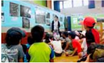
熱心に説明を聴き、写真を見つめる子どもたち