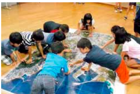
現在の与那原地図から、関わりの深い場所を探す子どもたち

終戦後、再び与那原へ戻ってきた人々がどのようにして復興していったのか、また戦争を乗り越えて「残ったもの」、戦争で「取り残されてしまったもの」をテーマにしたコ