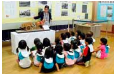
荷馬車を一心に見つめる子どもたち