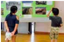
駅舎展示資料館や1トン爆弾の写真を目奪われる子どもたち