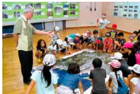
現在の与那原の街並みを説明する編集委員

「戦前の与那原」のコーナーには、1917（大正6）年ごろの与那原の風景を展示しました。海には山原船、陸には軽便鉄道の駅舎とレールが写っています。戦前の与那原は、海路では山原との交易が盛んで、荷物を運ぶ山原船が行き交っていました。陸路では、馬車が