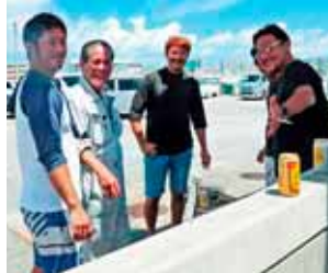
気さくなウミンチュの皆さん

各漁船の大漁旗のたなびく会場では、保冷库から出したばかりのシビマグロやゲルクン・タマン・ビタローなどが手ごろな値段で並び、買った魚は漁師さんたちがその場でいねいにさばいてくれます。施設の外では女性部が天ぷらを揚げ、いか汁を作って提供。地元で獲れた魚介類を味わう絶好の機会となりました。