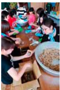
若手からベテランまで▲手分けして1000食以上のおにぎりを作る

女性会は朝早くから参加者にふるまうジュースを作り、子ども会が開会を告げる道ジュネーで参加。漕ぎ手だけでも700人が集った大きな大会を区民全体で支えました。