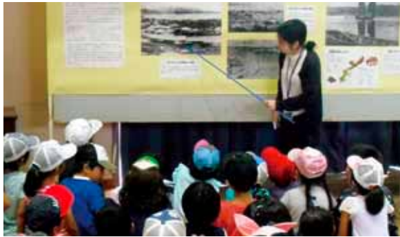
子どもたちに戦前の街並みを説明する職員