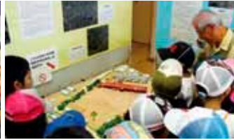
与那原国民学校の模型を囲む編集委員と子どもたち

コーナーです。町の復興の様子として、茅葺き校舎、「まさひろ」で有名な比嘉酒造(現在のまさひろ酒造株式会社)、与那原テックの写真展示しました。「懐かしい」、「初めて知ったと、幅広い世代から大きな反響がありました。戦争を乗り越えて「残ったもの」としては、大綱曳や与那原駅舎跡の写真展示し、与那原には現在でも大切な歴史や文化が受け継がれていることを伝えました。「取り残されてしまったもの」として、最後に展示された1トン爆弾の写真から、根深く残る戦争の被害を学んだ児童も多くいました。