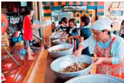
▲炊き上がったジュースを混ぜながら冷やす。風を送るのは子どもたち