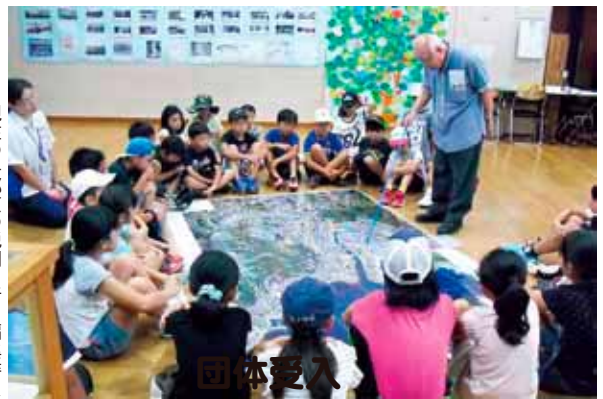
現在の与那原の説明を行う編集委員

コーナーです。町の復興の様子として、茅葺き校舎、「まさひろ」で有名な比嘉酒造(現在のまさひろ酒造株式会社)、与那原テックの写真展示しました。「懐かしい」、「初めて知ったと、幅広い世代から大きな反響がありました。戦争を乗り越えて「残ったもの」としては、大綱曳や与那原駅舎跡の写真展示し、与那原には現在でも大切な歴史や文化が受け継がれていることを伝えました。「取り残されてしまったもの」として、最後に展示された1トン爆弾の写真から、根深く残る戦争の被害を学んだ児童も多くいました。