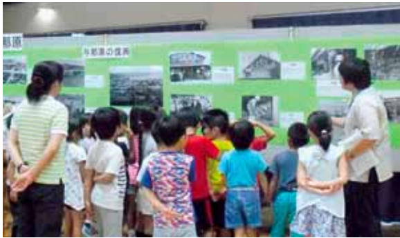
子どもたちに戦後の街並みを説明する職員

「与那原町民平和の日・慰霊の日」関連合同企画展が6月15日（金）から24日（日）までの10日間、与那原町コミュニティセンターで開催されました。開催期間中、台風の影響で1日だけ休館しましたが、町内外から1760人の来場者が訪れました。