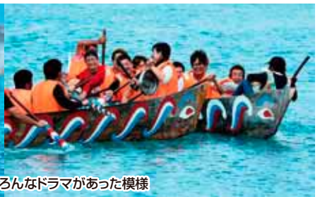
接触、転覆…海上ではいろんなドラマがあった模様