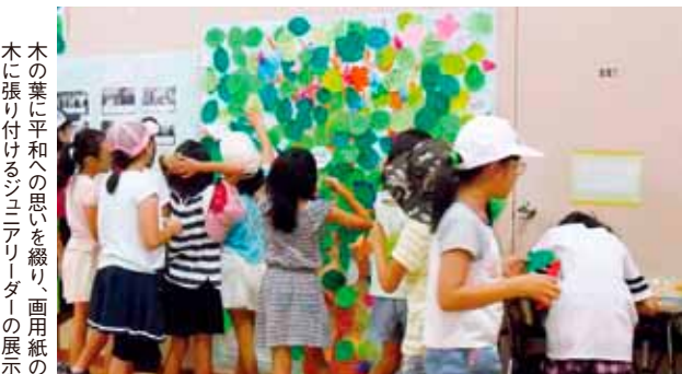
木の葉に平和への思いを綴り、画用紙の木に張り付けるジュニアリーダーの展示

今回の企画展では初めての試みとして、町内の各施設を巡る「スタンプラリー」を行いました。企画展会場のコミュニティセンターを含めた、町内の4つの施設で平和学習を行ってスタンプを集め、『よなばるの民話』など、与那原町の歴史や文化を知るのに役立つ景品と交換するイベントです。10日という短い期間、また、1人1回という制限つきでしたが、153人もの見学者が4つの施設を巡り、与那原について多くのことを学びました。