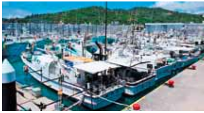
船同士を絶妙な間隔で並べている

漁業者たちにとって船は「第二の住まい」。先島諸島を襲い、本島も強風の影響を受けた台風8号は、地元の漁師さんたちの間で襲来前から情報交換が行われ、前日の漁港は40隻ほどの漁船が漁港内にすき間なく並ぶ姿が見られました。漁船同士をロープでつなぎ、さらにすべての船首から岸壁の係船柱にロープを渡した姿は、まるで大綱曳のよう。引き合いながらバランスを保ち、互いを守る姿に、ウミンチュの心が見える気がしませんか。