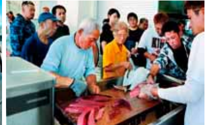
三枚下ろしを見るのも楽しみのひとつ