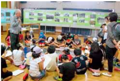
戦時中について語る編集委員と、熱心に話を聴く子どもたち

とうとう米軍が渡具知（読谷村）の海岸から沖繩本島に上陸し、日米両軍は南北に分かれて激しい戦闘を繰り広げました。同年5月13日ごろには運玉森の北部に米軍が迫ってきました。21日まで激しい戦闘が続き、与那原一帯は米軍に制圧されてしまいます。戦闘後、廃墟となった与那原の写真と、戦前