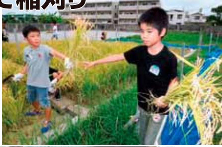
収穫した稲を手渡す児童 (7月4日与那原小学校)