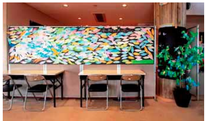
▲来場者が作った平和のメッセージと折鶴