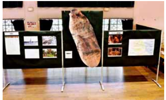
▲1トン爆弾の実寸模型

そのほか、場内でひときわ目を引く展示物が、糸満市摩文仁の平和祈念公園にある「平和の礎」を再現したパネルと1990年にオリオン通り入口付近で発見された1トン爆弾の実寸模型です。平和の礎再現パネルの前では、親戚の名前を探す方や、刻銘された名前をしながら自身との間柄を説明する方も見られました。1トン爆弾の実寸模型は、その大きさを実感してもらうために展示したものです。大きさは180cmを越え、来場者からは「大きい」「こんなものが与那原に埋まっていたなんて知らなかった」という声がありました。