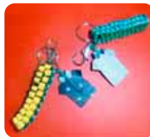
父の日のプレゼント、キーホルダー作り