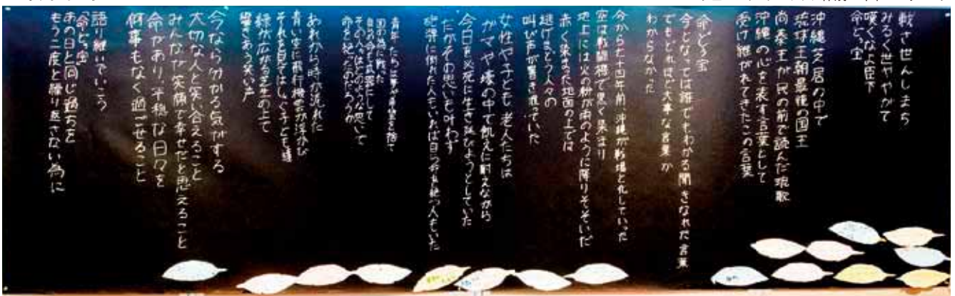
▼ジュニアリーダークラブ作成の平和のメッセージ

今回、与那原町ジュニアリーダークラブが作成・展示したのは、平和への思いをこめた詩と平和のメッセージです。詩は、今年5月21日に開催された「与那原町民平和の日」記念式典で読み上げたものです。平和のメッセージは、鳳凰(ほうおう)をイメージした鳥のモチーフに羽を模したメッセージカードを貼り付けてゆくもので、展示された当初は少なかった羽が、展示終了後には鳥が見えないくらいになりました。