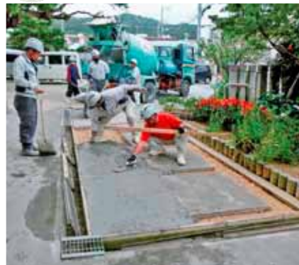
与那原区公民館入口を無償で舗装する工事業者の皆さん