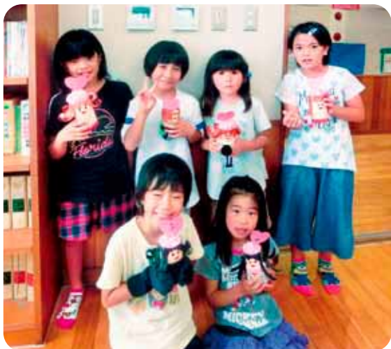
お母さん、いつもありがとう。ステキな小物入れができたよ!

5月の母の日は、お母さんをイメージした小物入れを作りました。お母さんの髪の色や髪型を工夫してカールさせたりして、そっくりに出来上がっていました。6月の父の日は、クラフトテープを用いたキーホルダーを作りました。