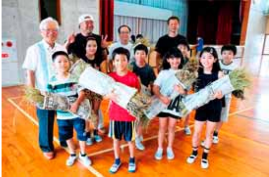
藁を実行委員会に贈呈 (7月10日与那原小学校)

与那原小学校・与那原東小学校5年生が7月初旬に稲刈りを行いました。児童らが3月に授業の一環で校内敷地で植えた稲の穂先には黄金色の米がアーチを作っていました。