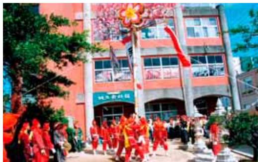
高さが6メートルのホールで旗頭の展示が可能に