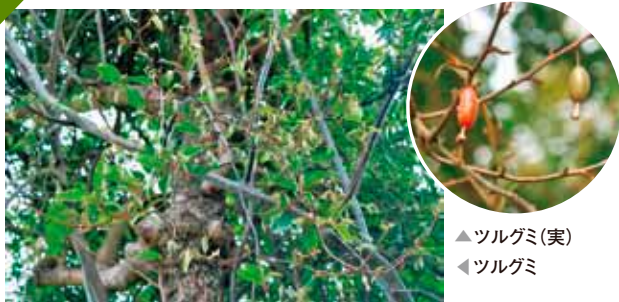
▲ツルグミ(実) ▼ツルグミ