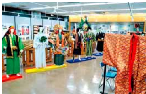
支度衣装展期間中の資料館内部