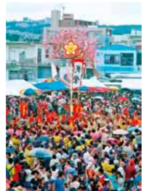
▼西旗頭に使用されるツルグミ

お問い合わせ 生涯学習振興課 町史編纂係 ☎871-9981 Fax098-871-9982