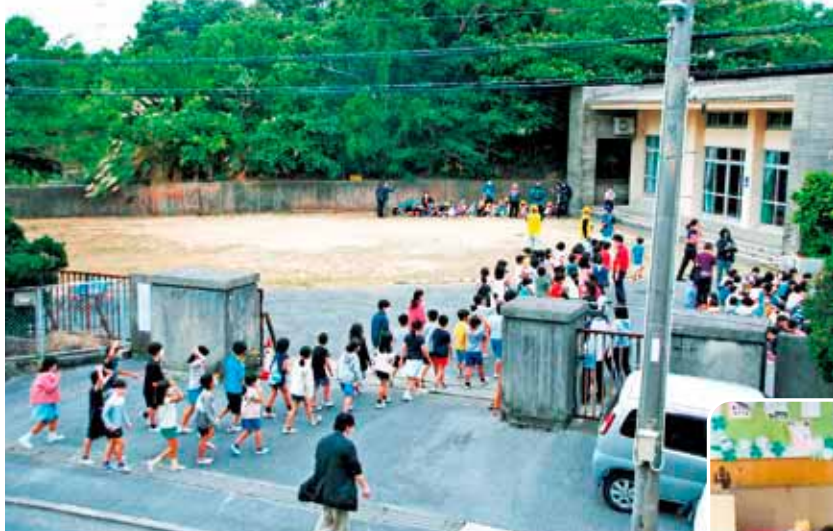
▼避難場所の大見武集落センターを目指す与那原小・与那原幼稚園の児童