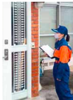
▲住宅を訪問する消防団

住宅用火災警報器は、火災の早期発見に有効です。まだ設置がお済みでない方は、大切な命や財産を守るためにも設置をお願いします。