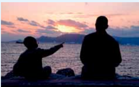
東浜から見る初日の出(写真は2017年)