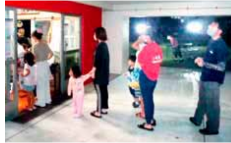
バーベキューに代えてお弁当を支給

いてもテーブルを離して設置し、いすを1つのテーブルに4個までとするなどさまざまな感染防止対策に取り組みました。