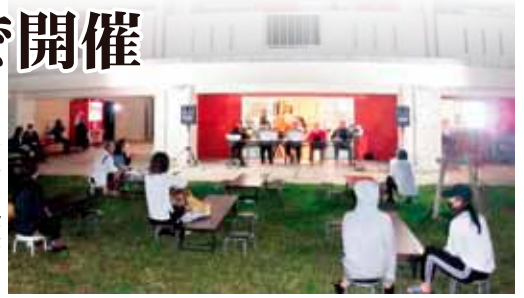
広場の観覧席も間隔を空けて