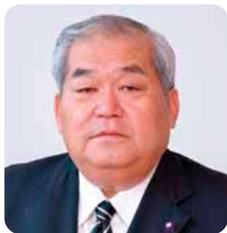
与那原町議会議長

結びに、与那原町にとりまして新しい年が、夢と希望に満ちた素晴らしい年になりますよう心より祈念申し上げ、新年のごあいさつとさせていただきます。