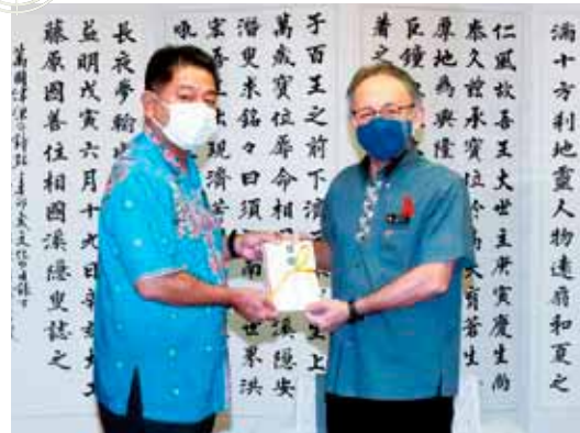
玉城デニー知事へ首里城再建支援 募金を託す照屋勉町長 11月9日

令和元年10月31日に火災で焼失した首里城の再建に向けて町が行った「首里城再建支援募金」は、昨年10月末までの間に139万6546円が集まりました。照屋勉町長は昨年11月9日に県庁に玉城デニー知事を訪ね、全額を託しました。