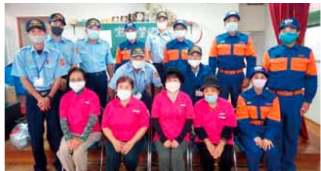
◀上与那原区を回った訪問調査員

※住宅用火災警報器については、東部消防組合HP「住宅防火関係」を参照してください。