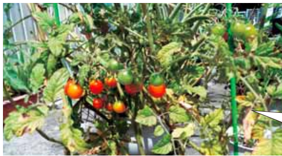
甘酸っぱい実でした♪ アツアツの夏作でした♪