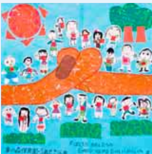
町内の保育施設の子どもたちによる絵画が展示されました 7月 役場1階町民ラウンジ