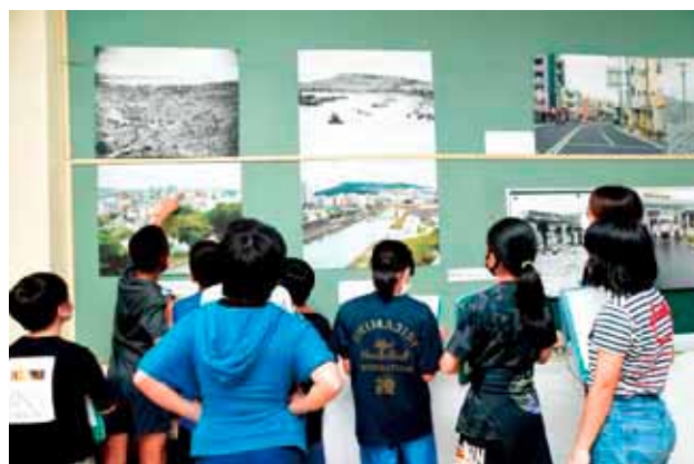
▲町役場が作成した、沖繩戦直後と現在の風景を比較した写真パネル展示を教室内に再現。感想を口にしながら見入る児童たち

真剣な表情で見入った児童らからは「建物が全部爆弾で壊れていることにびっくりした」「戦争から76年でこんなに(景色が)変わってすごいと思った」との声が聞かれました。