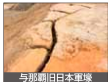
与那覇旧日本軍壕

展示期間 ▶ 9月13日(月)～9月27日(月) ※祝祭日9/20、23は休館 文化講座 ▶ 9月19日(日) 午前10時～正午(予定)