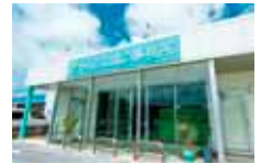
与那原町字東浜23番地2 (ローソン与那原東浜店となり)