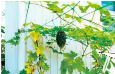
育てていたゴーヤーが 実をつけました♪

「交流センターひざし」は、障がい者の自立と交流、社会参加を促進するために、社会見学やピクニックも実施しています。参加するには利用申請などが必要です。下記番号までお気軽にお問い合わせください。