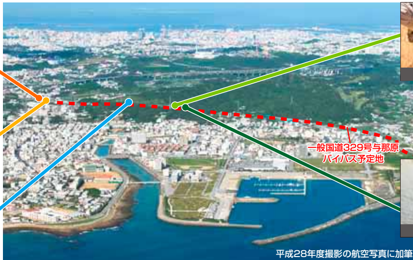
平成28年度撮影の航空写真に加筆