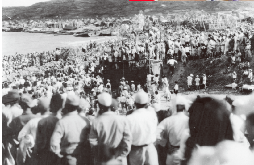
人でにぎわう大綱曳。かつては与那原の砂浜(与那原ビーチ)で行われていた。=1950年ごろの風景