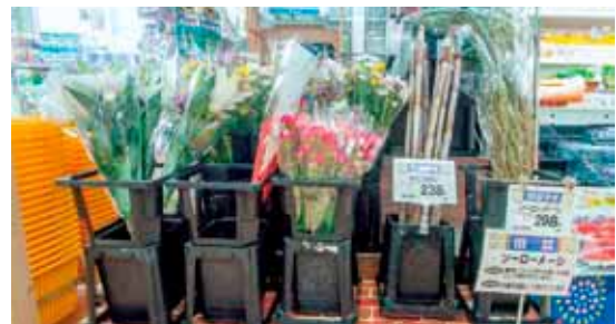
スーパーの店頭に並ぶ旧盆の供え物

木の枝の正体はメドハギという植物です。「ソーローハーギー」や「ソーローメーシ」という商品名で販売されています。旧暦7月13日のウンケーの日にあの世から帰って来たご先祖さまが箸として用いると言われていいます。また、箸以外にもご先祖さまが足を洗う箸(ほうき)として、玄関先に水を張ったタライと一緒に置く家庭も