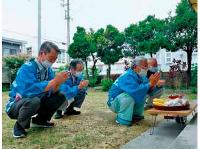
町内の拝所を回り祈願する与那原大綱曳実行委員会

例年、与那原大綱曳まつりが安全に行われるよう併せて祈願してきましたが、昨年に続きコロナウイルス感染症拡大防止のため、まつりの中止が決定。実行委員会は稲の生長とともにコロナウイルス感染症の終息を祈願しました。