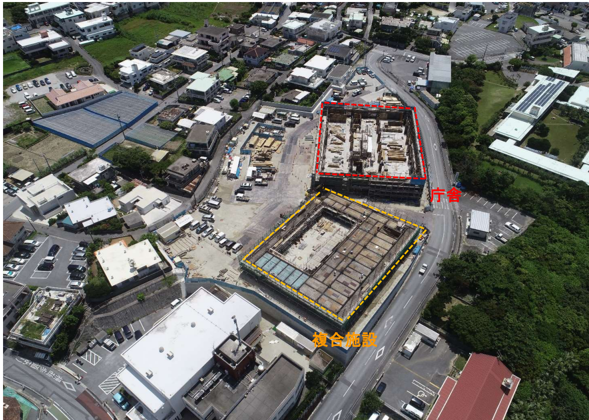
①全景写真【東側より】