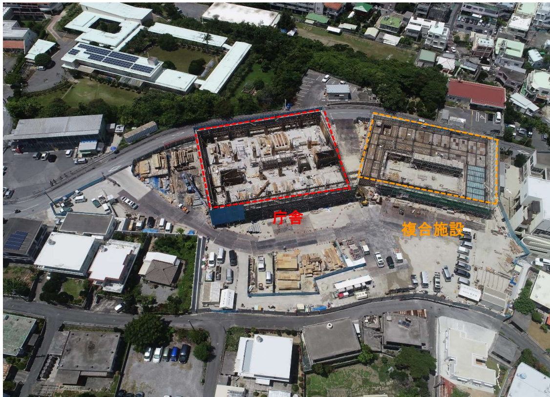
②全景写真【南側より】