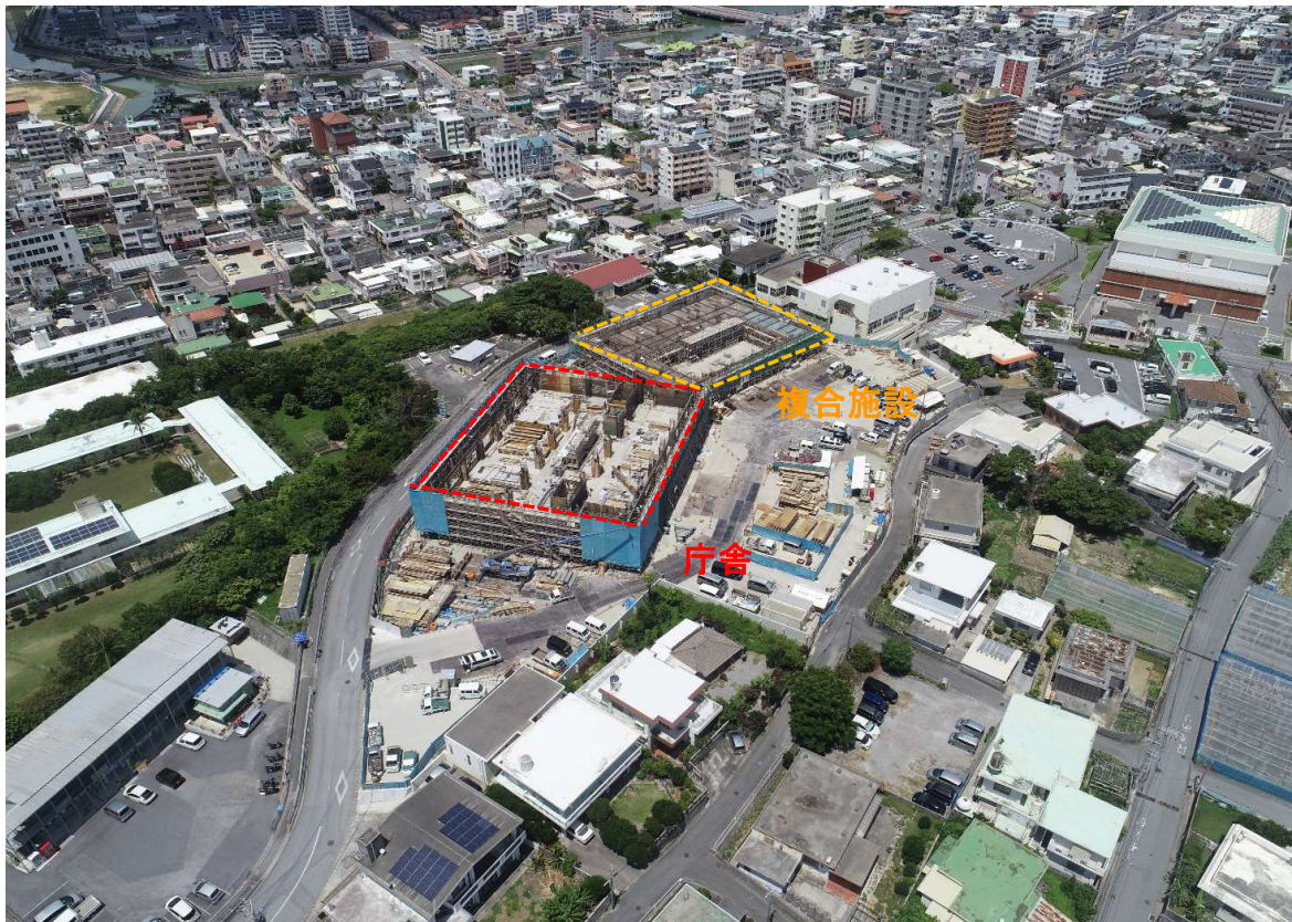
②全景写真【西側より】