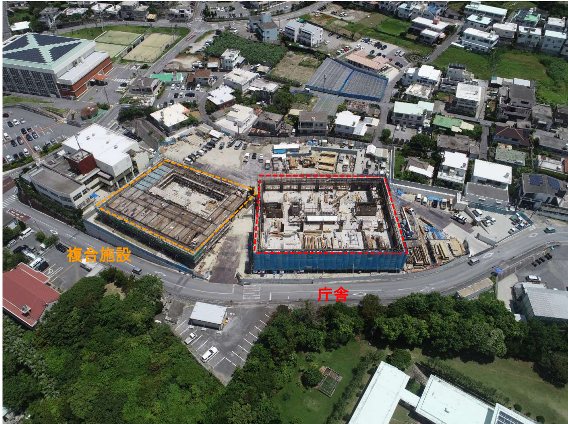
①全景写真【北側より】