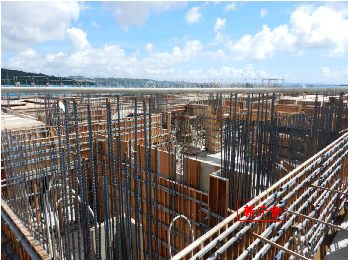
①新庁舎 2階梁配筋状況。3階床枠設置状況。