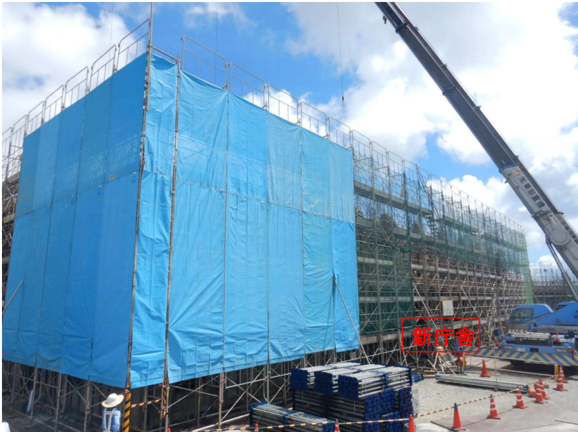
①新庁舎 2階梁配筋状況。3階床枠設置状況。