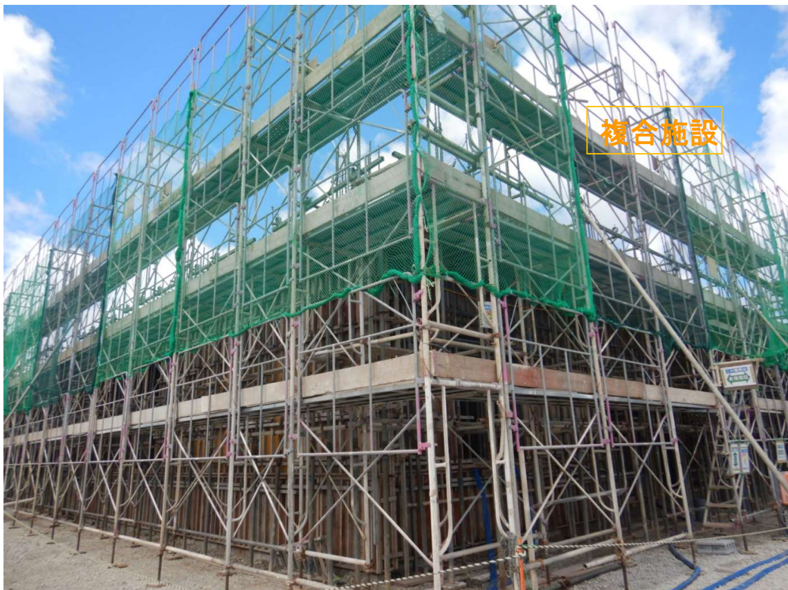
②複合施設 2階床スラブ配筋・枠完了。打設前清掃中。