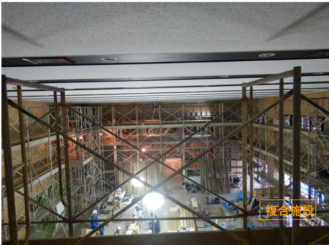
②複合施設 大ホール-内部足場盛替え。