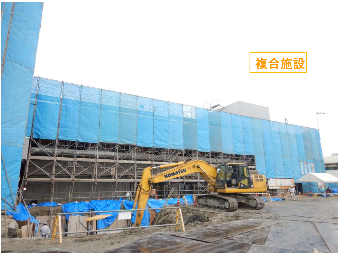
②複合施設 赤瓦マスブロック工事完了。塗装工事中。