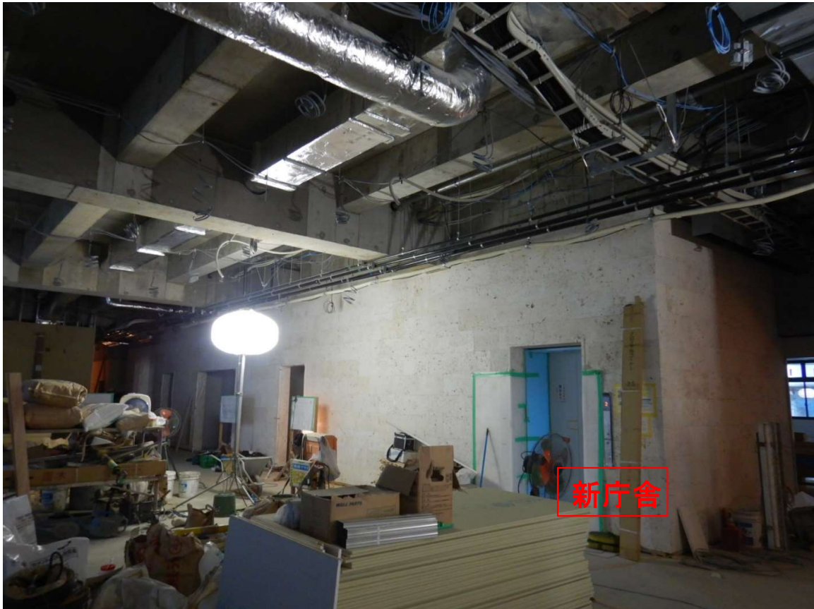
①新庁舎 1階-町民ラウンジ-壁-琉球石灰岩張り完了。