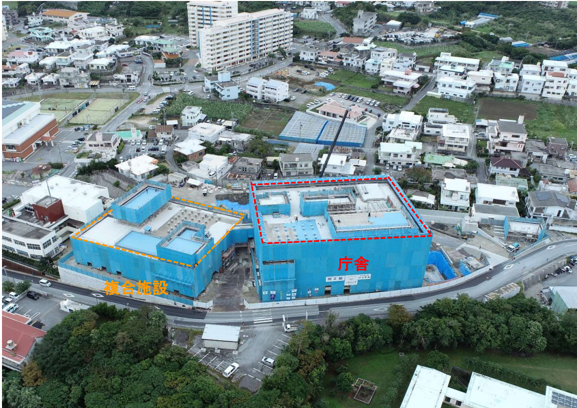
①全景写真【北側より】