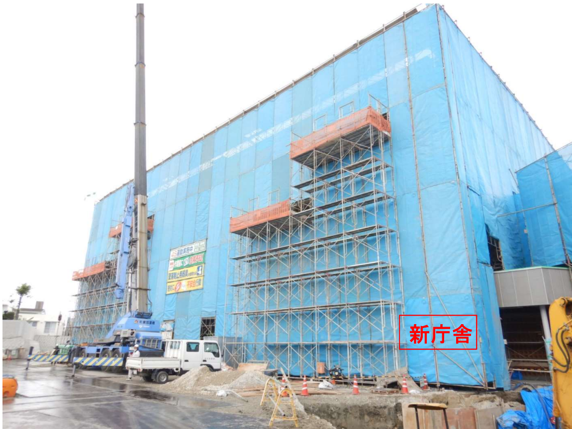
①新庁舎 赤瓦マスブロック工事完了。北面・東面塗装準備。