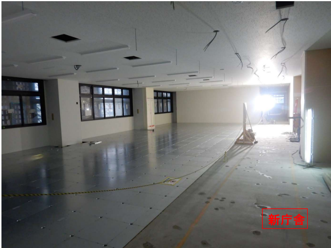
①新庁舎 2階-OAフロア一敷き完了。