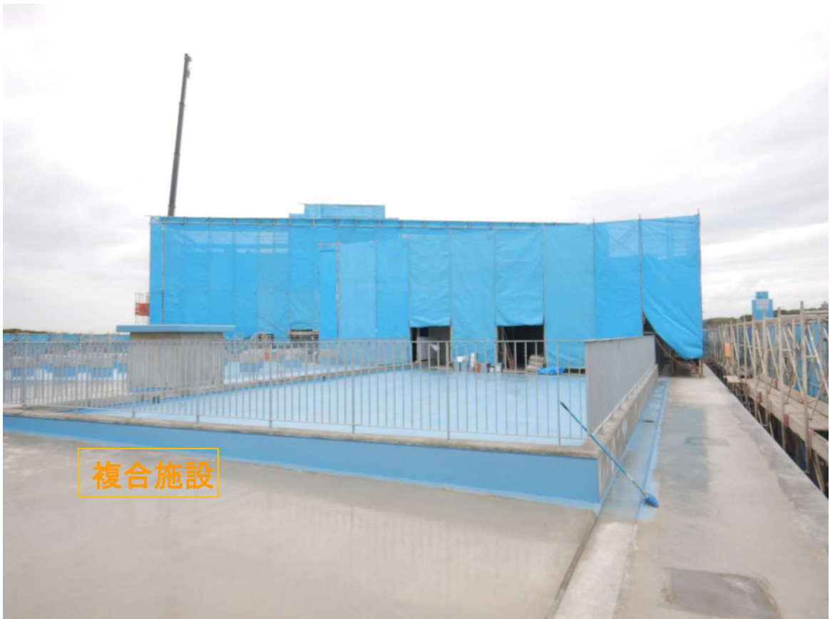
①新庁舎 屋上階-底面-防水。外部-塗装工事。