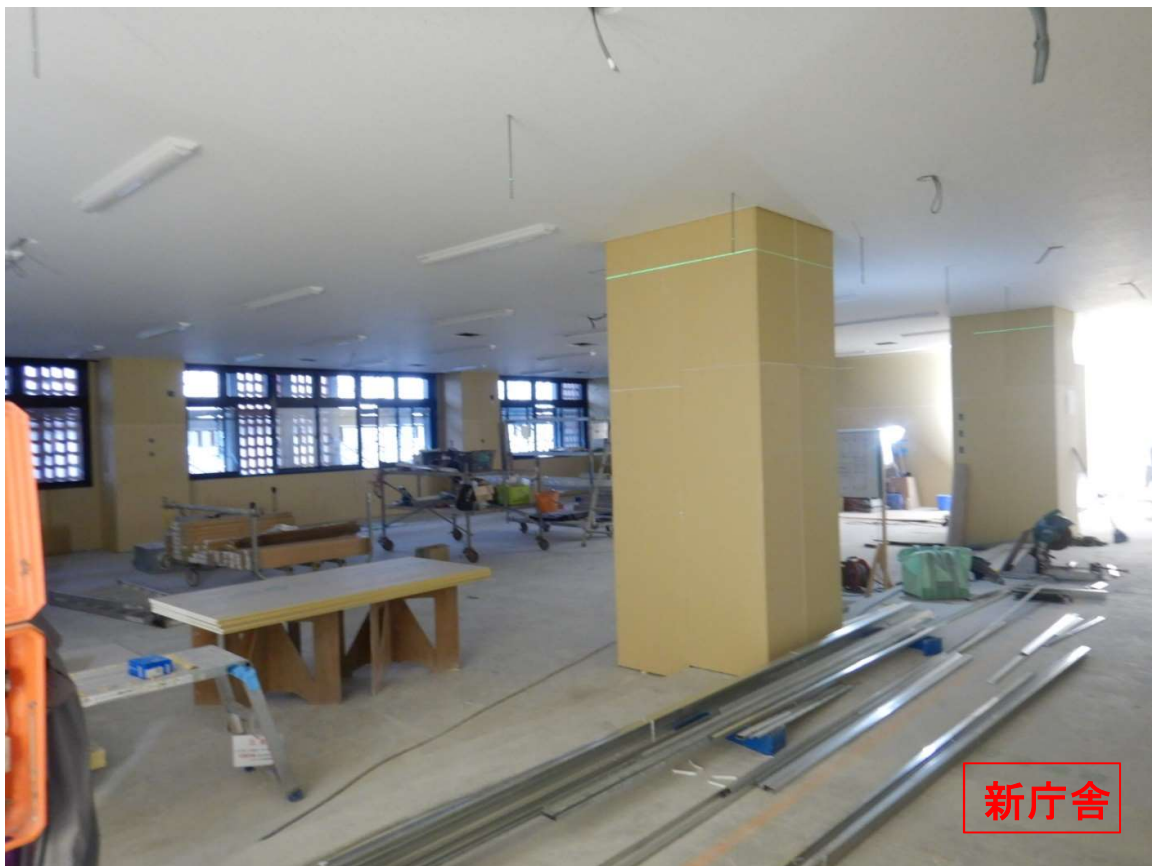
①新庁舎 3階-天井仕上完了。