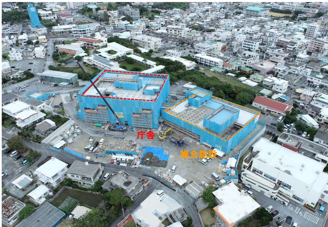
②全景写真【南側より】