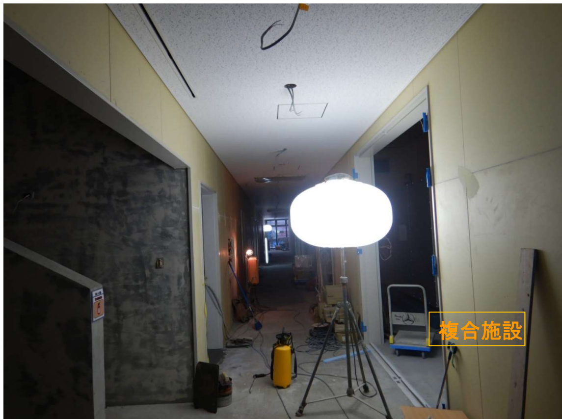
②複合施設 2階-天井仕上完了。