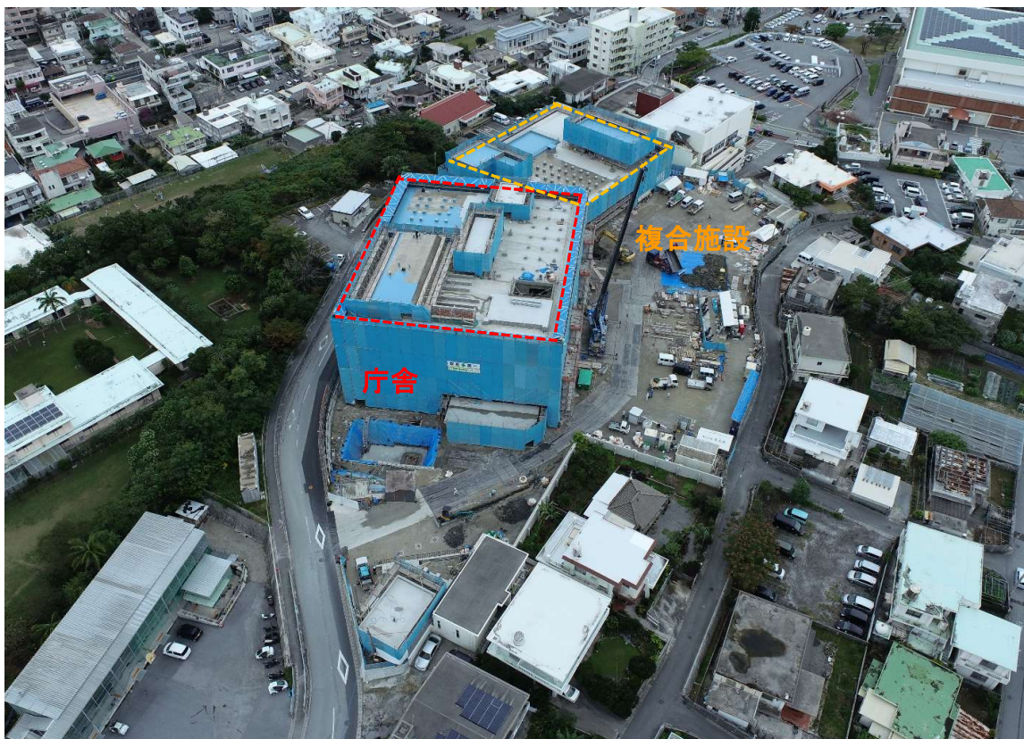
②全景写真【西側より】