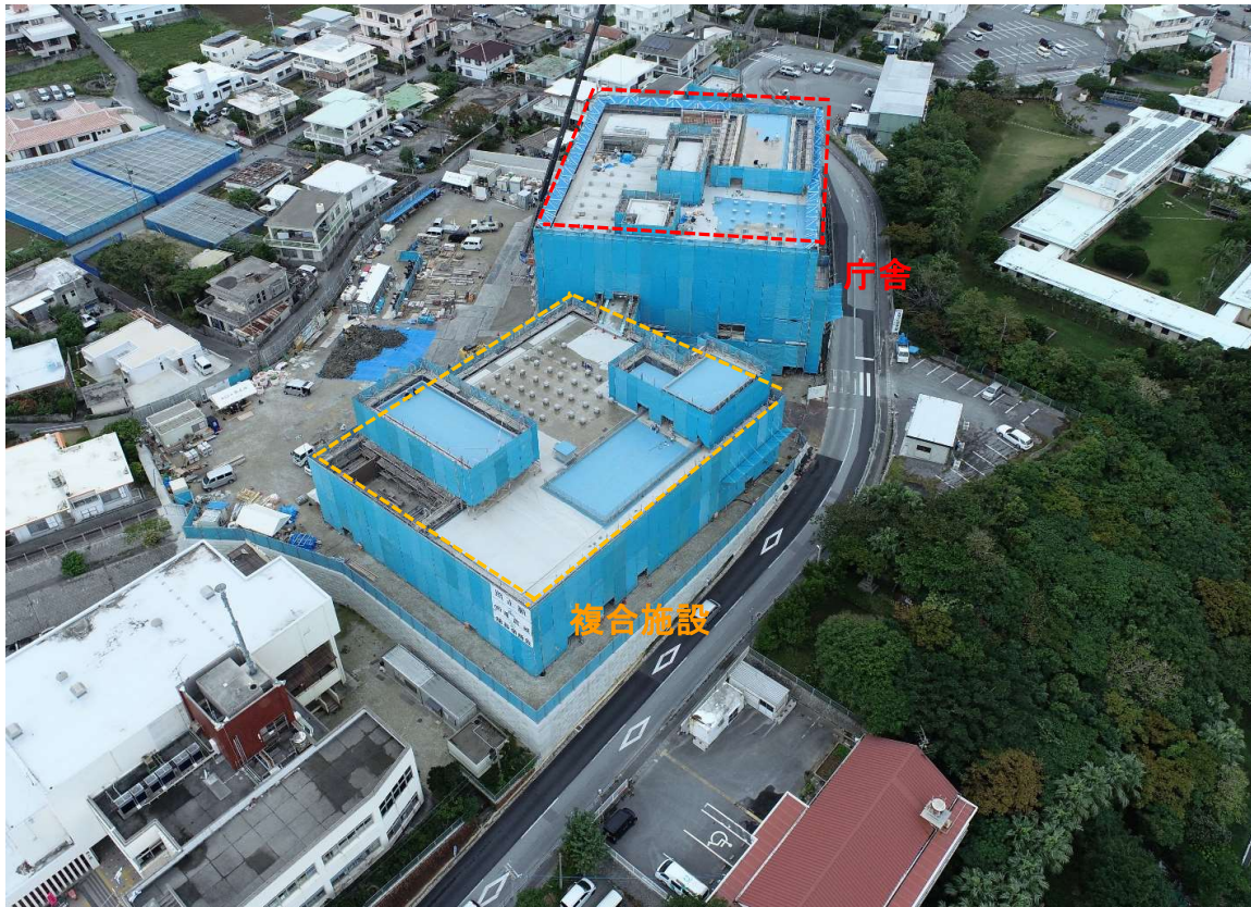
①全景写真【東側より】