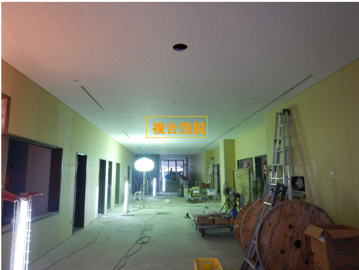
②複合施設 1階-天井仕上完了。