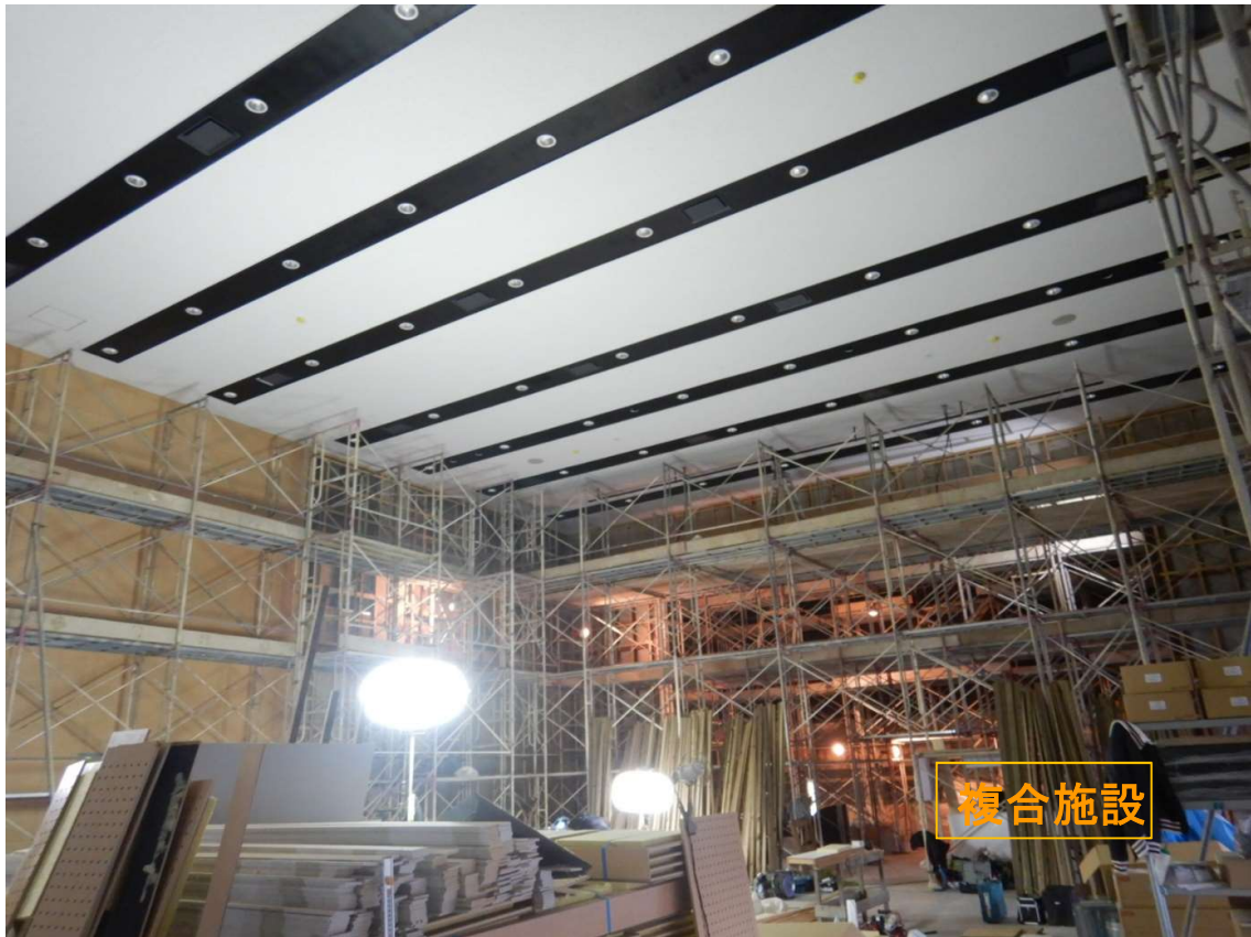
①複合施設 大ホール-内部足場盛替え。