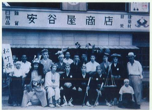
「安谷屋商店」昭和26年、大綱曳きのシタクの集合写真