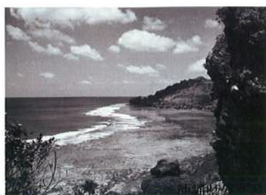
糸満市 摩文仁海岸

摩文仁の海岸を山手の方に登つて行き、照明弾の間をぬつて匍匐前進で北をさして進んでいった。夜が明け初め、夕方に出てきた摩文仁の海岸を振り返つて見るとそこからわずか一キロしか離れていなかった。やがて日が昇り、周りを見渡したとき、五メートル先に黒く膨れて腐臭を放つた日本兵の死体があつた。昼頃に米兵が一人やつて来て、その死体にガソリンをまいて火を点けた。私は体を倒した状態