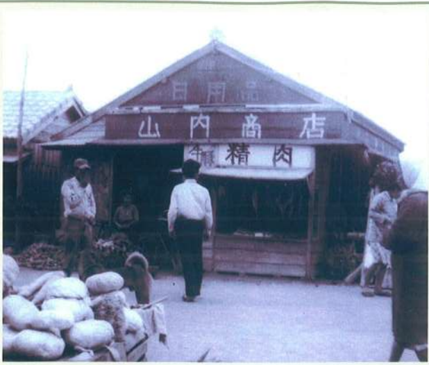
「山内商店」昭和30年頃

与那原にあった商業を中心に写真を掲載致しました。与那原関連の古い写真などがありましたらご提供を宜しくお願いします。ご連絡頂けましたら、こちらからコピーに行きます。