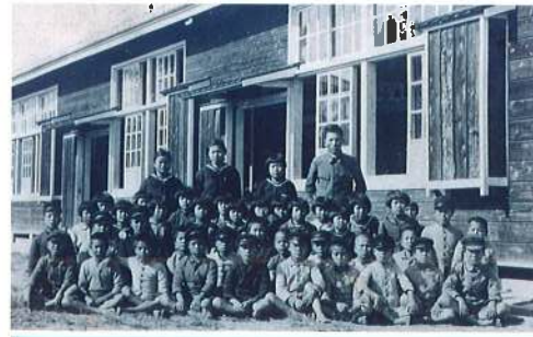
与那原国民学校校舎。 (御殿山。現：青少年広場)

また家では両親から言われて、毎日兵舎の周りの土手の草刈作業をした。軍事教練ではルーズ