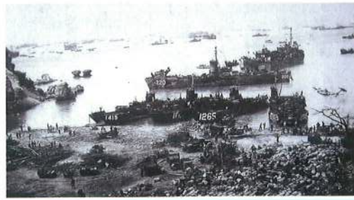
昭和20年4月1日 読谷村の渡具知海岸

から宇江城（糸満市）の集落に向かい夕方には着いたが、そこも避難民がいっぱいだった。私たちは壕の入り口で中の避難民に向けて砲弾をちらつかせた。「立ち退かなければ爆破させる」と説得した。そして避難民が出た後に私たちは壕に入った。