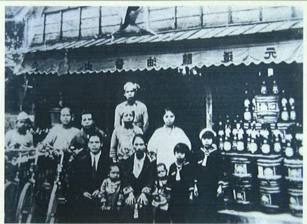
昭和11年頃「森山醤油」