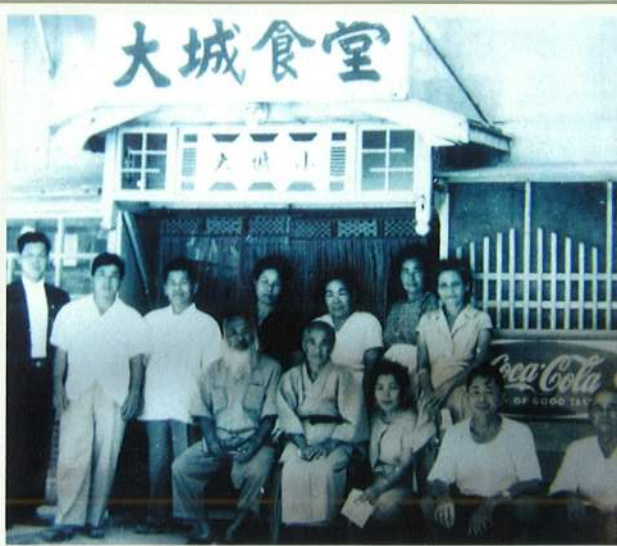
「大城食堂」昭和30年頃