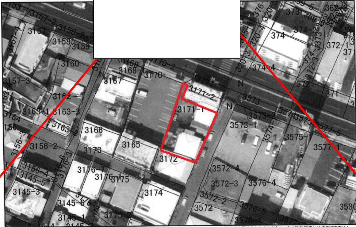
地番図。(航空写真用) map

※ おおよその位置を表示しているのので、公簿等により必ず現地確認を行ってください。