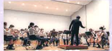
ウェルカム演奏 那覇ジュニアオーケストラ ストリングス