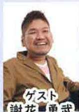
ゲスト 謝花 勇武 (シンガーソングライター)