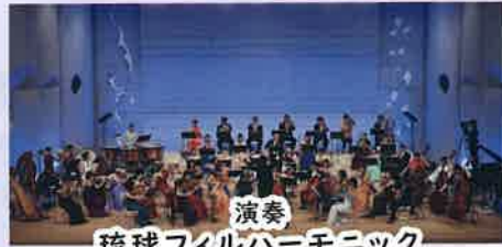
演奏 琉球フィルハーモニック オーケストラ