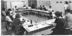
プロジェクト会議の様子

また、本公演では障害のあるアーティストの活動の場の拡充と、共演している音楽家との相互理解と交流を深めていく場にもなります。さらに、公演終了後に冊子を作成しそのノウハウを全国に広め、文化芸術による共生社会の推進を目指します。