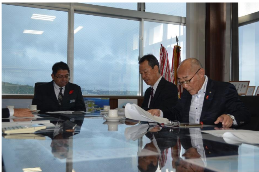
↑監査結果報告書を読み上げる監査委員